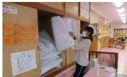
業務を細分化し、働きやすさに繋がっています。

保育補助者は、保育士が子どもと十分に関わる時間が持てるよう遊び(活動)の前後の準備や片付け、食事の配膳や食後の片付け、午睡時の寝具の準備等、保育の運営をする上で必要な役割を担っています。