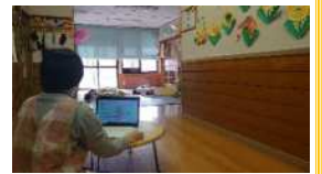
園児管理ソフトの入力の様子

園児管理システムで児童簿や成長記録、登降園の管理を行うほか、データを共有化することで、重複作業の軽減など、事務作業の時間短縮や負担軽減につながっています。